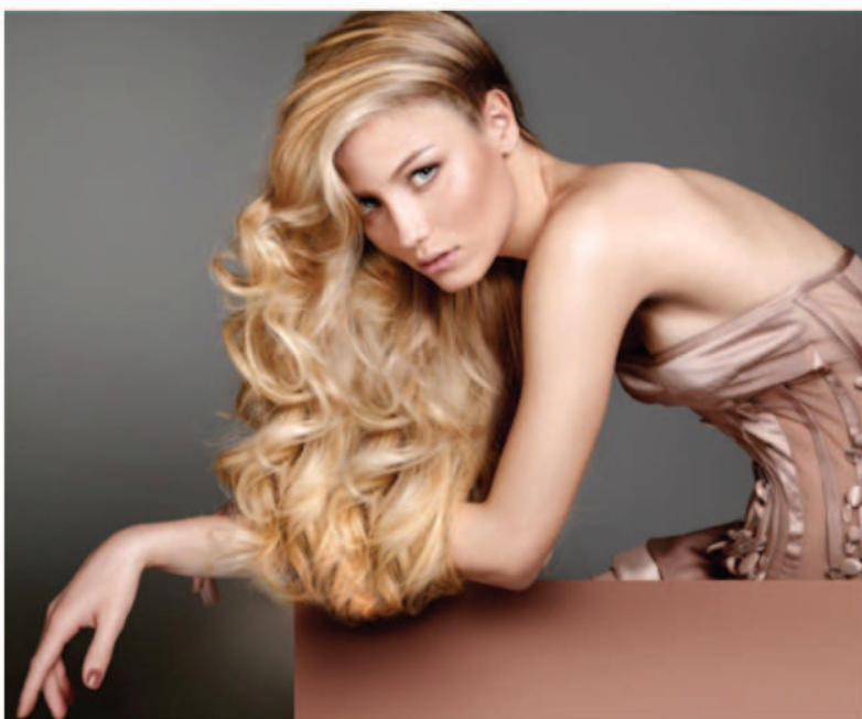
Extensions Salon Kondifientiel

Experte beauté Yahoo Pour Elles - ven. 14 nov. 2014 17:33 HNEC